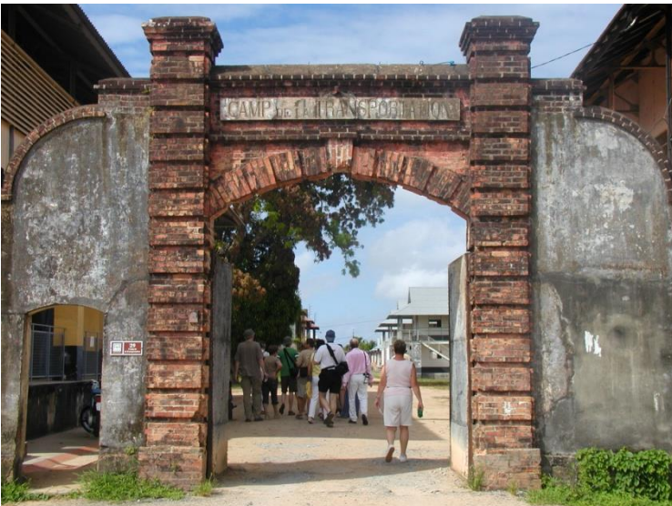
De bagne te Saint-Laurent du Maroni