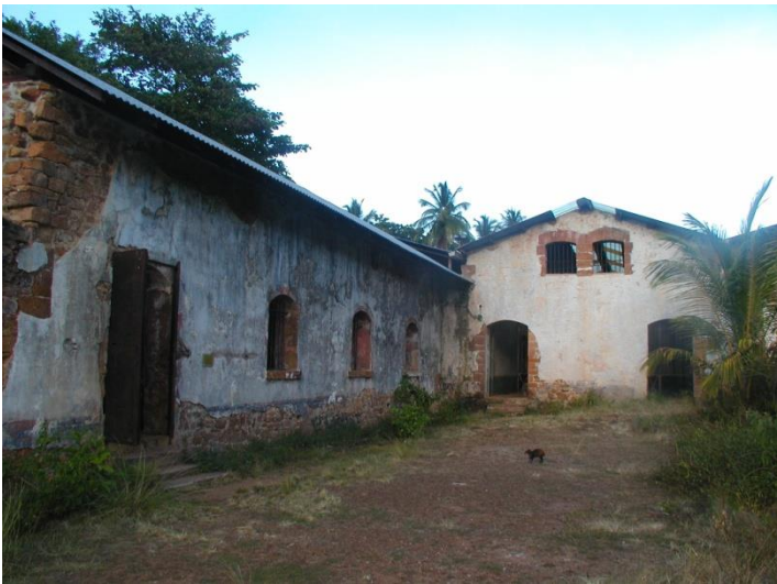
De ruines van de bagne op Duivelseiland

werkelijke spion was echter Ferdinand Walsin-Esterhazy die een vuile rol speelde. Een nieuw benoemd hoofd van de inlichtingendienst van het leger, kolonel Picquart, kwam in zijn onderzoek naar de zaak achter de werkelijke gang van zaken. Hij ontdekte de rol van Esterhazy en gaf dit door aan zijn superieuren. Vervolgens werd er alles aan gedaan om herziening van het proces te voorkomen, en het geheel in de doofpot te laten verdwijnen, om de “eer van de strijdkrachten” te redden.